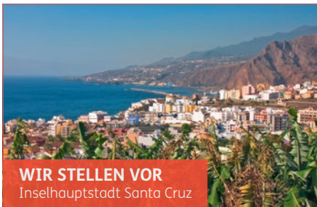
WIR STELLEN VOR Inselhauptstadt Santa Cruz

Mit dem Linienbus erreichen Sie bequem die ca. 5 km entfernte Hauptstadt Santa Cruz. Das lebendige, charmante Städtchen bietet historische Gebäude, kleine Gassen und pittoreske Plazas. Schöne Geschäfte und hübsche Cafés laden zum Verweilen ein. Wir empfehlen Ihnen das Café „Don Manuel“ gegenüber dem Kirchturm an der Plaza de España.