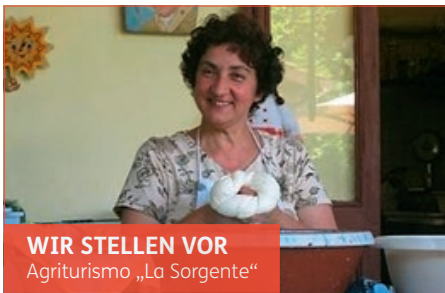
WIR STELLEN VOR Agriturismo „La Sorgente“

Seit drei Generationen ist das herrlich gelegene Landgut „La Sorgente“ in Familienbesitz. Bei Ihrem Besuch sehen Sie u.a. die alte Olivenmühle und erfahren, wie die Familie den typischen Käse-Zopf zubereitet. Inmitten von Zitronenhainen genießen Sie frisch gebackenes Brot, aromatische Tomaten, Mozzarella-Käse und köstlichen Landwein. Buon Appetito!