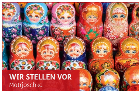
WIR STELLEN VOR Matrjoschka

Die „Puppe in der Puppe“ mit Talisman-Charakter ist eines der wohl beliebtesten Souvenirs Russlands. Die aus Holz gefertigten und bunt bemalten, ineinander schachtelbaren Matrjoschkas wurden erstmals im Jahre 1890 von dem Maler Sergei Wassiljewitsch Maljutin entworfen und von dem Kunsthandwerker Wassili Petrowitsch Swjodschkin gefertigt.